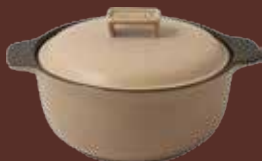
Pentola con coperchio tortora Dove-gray cooking pot with lid cm ø 28,5x33,5x18h - cl 400

For cooking over the flame, oven, microwave and electric plate.