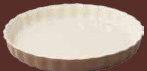
Tortiera tortora Dove-gray pie dish cm ø 30x4h