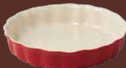
Tortiera rosso mattone Brick-red pie dish cm ø 26x5h