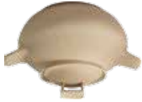
Potatoes cooking pot ø 22x27,5x17h cm - 330 cl

The Potato Baker is made with a natural, unglazed fire-clay, for a totally dry cooking (with no water at all). No need to use any fire scatterer net.