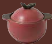
Casseruola con coperchio prugna Plum-red casserole with lid cm ø 15x18,5x14,5h - cl 90

Le pentole, le tajine e i tegami sono disponibili nelle varianti colore tortora, rosso mattone e antracite.