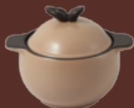
Casseruola con coperchio tortora Dove-gray casserole with lid cm ø 15x18,5x14,5h - cl 90