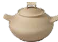
Cuocipatate con coperchio cm ø 22x27,5x17h - cl 330

Il Cuocipatate è realizzato con una particolare argilla da fiamma, naturale e non smaltata, per una cottura esclusivamente a secco (con totale assenza di acqua). Non è necessario usare la retina spargifiamma.