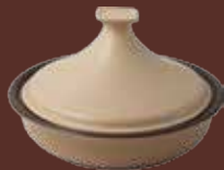
Tajine con coperchio tortora Dove-gray tajine with lid cm ø 31,5x19,5h - cl 250