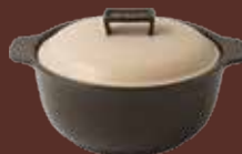
Pentola con coperchio antracite Black cooking pot with lid cm ø 20x25x14h - cl 150