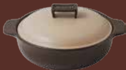
Tegame con coperchio antracite Black saucapan with lid cm ø 27,5x33,5x13,5h - cl 250