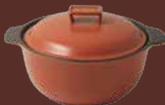
Pentola con cop. rosso mattone Brick-red cooking pot with lid cm ø 23,5x28,5x15,5h - cl 250